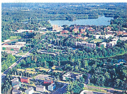
自然豊かなセント・ジョンス大のキャンパス

3年夏に海星学院高に戻り、「4年後の自分を考えたときに、可能性を広げたい」とセント・ジョンス大への進学を決意。進学に当